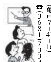
平成26年度 子ども会育成指導者地域別研究協議会日程表

【日時】下表のとおり 【会場】子ども会活動に興味のある方ならどなたでも無料 【地区】ごとに異なりますので、お問い合わせください。