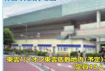
東雲1【イオン東雲店敷地内(予定)】 【定員49人】