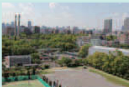
▲緑の中の都市「CITY IN THE GREEN」

・地域が一体となって、公園や、小学校にある校庭の芝生化を推進します。また、公共施設での屋上緑化や壁面緑化を進めます。 ・街路樹を増やすとともに、統一感のある街路樹整備を進めます。また、計画的な剪定等、街路樹の適切な維持管理を行います。 ・区民・事業者に対する緑化指導を推進するとともに、屋上(壁面)緑化と生垣に対する助成制度の充実と普及を図ります。さらに、歴史・文化を伝える緑の保全・再生を行います。