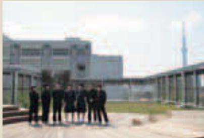
▲木のぬくもりを感じる第二亀戸中学校