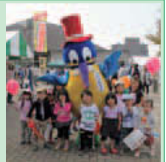
▲笑顔がいっぱいの区民まつり(木場公園)