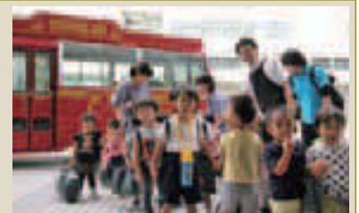
▲江東湾岸サテライト保育所の送迎

・地域需要に応じて認可保育所(※)の整備を進めます。また、子ども・子育て支援法の趣旨に基づき、認可外施設から認可施設への移行を進めます。同時に、保育の実施者として、保育施設指導監督を実施し、保育の質の維持・向上を図ります。既存の保育施設については、改築や耐震補強工事と併せて改修工事に取り組み、児童の保育環境や施設の安全性の向上を図ります。 ・延長保育、病児・病後児保育など、保護者の多様な就労形態や家庭環境に応じた柔軟な保育サービスを提供します。