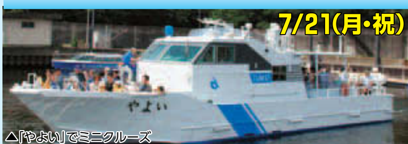
▲「やよい」でミニクルーズ

「海の日」記念行事 時 7/21(月・祝)10:00~16:00(9:30開場) 場 東京海洋大学越中島キャンパス(越中島2-1-6) ※品川キャンパスも催し物あり 内容 どのたでも 費 無料 内容 企画展示「商船学校を周る街々」(7/1(火)~31(木)も開催 ※日・月曜および12(土)、26(土)を除く)、史跡めぐり、研究室・実験室公開など 申 当日直接会場へ [東京港ミニクルーズ] 時 やよい①10:30②12:30③13:50④15:10、カッター①11:00②12:00③13:00④14:00⑤15:00 ※天候等の都合により中止する場合があります 内容 やよい各40人、カッター各15人(抽選) 申 7/8(火)必着 申 往復はがきに希望者全員の住所・氏名・年齢・人数(4人まで)・希望する船(やよいまたはカッター)・希望出発時間(第1希望)を記入し、〒108-8477 港区港南4-5-7 東京海洋大学広報室「海の日越中島」係へ 明治丸シンポジウム 時 7/21(月・祝)13:00~16:30 場 東京海洋大学越中島キャンパス越中島会館2階講堂 内容 400人(先着順) 費 無料 申 当日直接会場へ 問 東京海洋大学総務課広報室 ☎5463-0355 [企画展示の問合先] ☎5245-7360 HP http://www.kaiyodai.ac.jp/