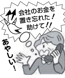
「会社のお金を置きました!!」

平成26年1月2日以降に転入した方や税の申告が遅れた方は、均等割額のみで計算した保険料で通知します。「賦課のもととなる所得金額」が確認できた時点で、正しい保険料に変更した