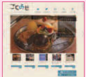
▲ホームページ「ことみせ」(画像は開発段階のものです)