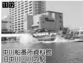
11 12 中川船番所資料館 旧中川・川の駅 ▲中川番所再現ジオラマは圧巻。館の前に水陸両用バスが発着