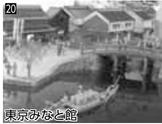
20 東京みなと館 ▲東京港の歴史や役割を展示や映像で紹介