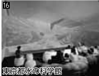
16 東京都水の科学館 ▲最新の「アクア・トリップ」や水を利用した体験装置が豊富