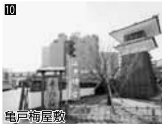
10 亀戸梅屋敷 ▲観光案内や物産販売など、地域の魅力を発信中!