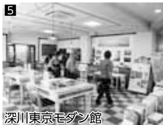
5 深川東京モダン館 ▲旧京都市深川食堂を改修した文化発信スペース