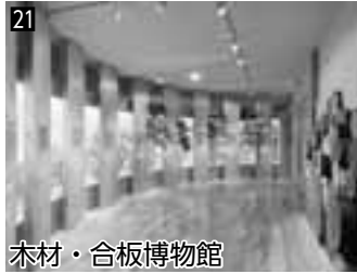
21 木材・合板博物館 ▲木材や合板、森林や地球環境についてさまざまに展示