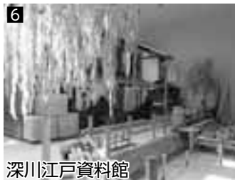
6 深川江戸資料館 ▲江戸の町並みをリアルに再現しています