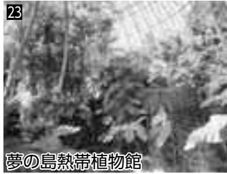
23 夢の島熱帯植物館 ▲熱帯雨林環境を再現した温室内のさまざまな熱帯植物は圧巻

5/18(日)9:00~16:00、区役所本庁舎で窓口業務を行います。取り扱い業務の詳細については、各担当窓口にご確認ください