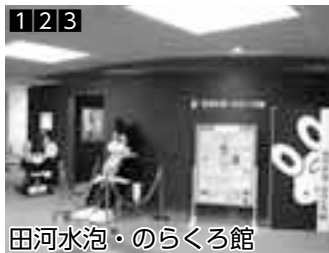
1 2 3 田河水泡・のらくろ館 ▲本区ゆかりの漫画家、田河水泡さんの業績を紹介

※休館日が祝日の場合は、その翌日が休館 ☆入館は、閉館の30分前まで ★入館は、閉館の60分前まで ◆休館日が祝日の場合は開館 注：入館無料等でも、展覧会などイベントごとに参加・見学費用がかかる場合があります。