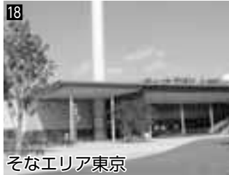
18 そなエリア東京 ▲各種展示やゲームなどで防災について学べます