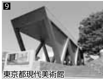
9 東京都現代美術館 ▲絵画・ファッション・建築等幅広く現代美術の展覧会を開催