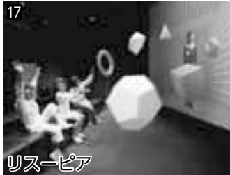
17 リスーピア ▲理科・数学の面白さを展示に触れて・見て・体感できます