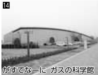
14 がすてなーに ガスの科学館 ▲ガスの役割や特長を実験やクイズで楽しみながら学べます!