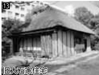
13 旧大石家住宅 ▲江戸時代に建てられた区内最古の民家建築