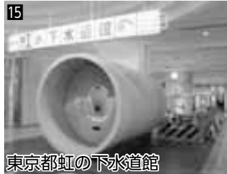
15 東京都虹の下水道館 ▲下水道について、お仕事体験等で学べます