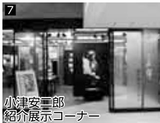
7 小津安二郎紹介展示コーナー ▲深川で生まれた日本映画界を代表する巨匠のゆかりの品々