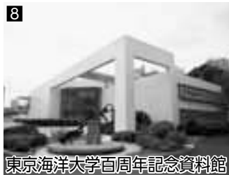
8 東京海洋大学百周年記念資料館 ▲商船教育史とその周辺の海事史を物語る資料を収集展示