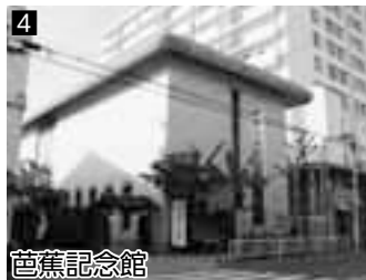
4 芭蕉記念館 ▲松尾芭蕉関係の資料を収集・展示しています