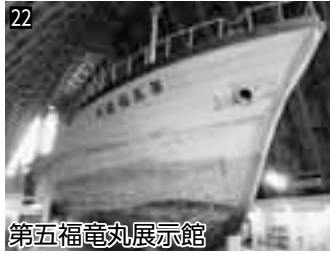
22 第五福竜丸展示館 ▲第五福竜丸の船体と関連資料を展示しています