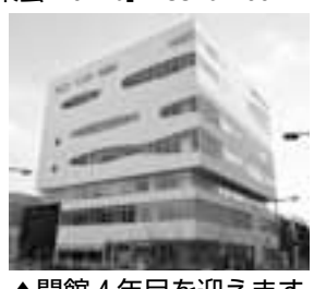
▲開館4年目を迎えます

プールやトレーニングマシンなど設備が充実!運動・パソコン・料理など各種プログラムも多数あります。小学3年生以下が利用できるスペースもあります※送迎バス運行中