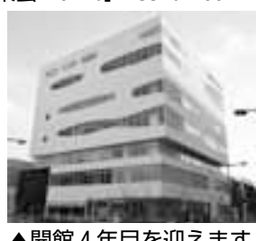
▲開館4年目を迎えます

プールやトレーニングマシンなど設備が充実!運動・パソコン・料理など各種プログラムも多数あります。小学3年生以下が利用できるスペースもあります※送迎バス運行中