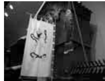
▲昨年度の端午の節句飾り

29(火・祝)~5/11(日) ※いずれも 費 大人400円、小中学生50円(観覧料)※小中学生は保護者同伴。同伴できない場合はお電話ください 申 当日直接会場へ 場 深川江戸資料館(白河1-3-28) ☎3630-8625