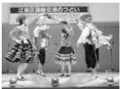
▲鮮やかな民族衣装と華麗なダンスで盛り上がるステージ

区内在住の外国の方とのふれあいを通して国際交流を深めるためのイベントです。世界の料理やマーケット、国際色豊かなステージ、各国の民族衣装の試着、外国人との英会話など外国文化のほか、お点前(茶道)、お香作り、花嫁衣裳(和装)の試着など日本文化も体験できます。国籍を問わず楽しめる催しが盛りだくさんです。 時 3月16日(日) 午前11時～午後4時 総合区民センター(大島4-5-1) 費 無料(料理等実費) 内別表のとおり 運 営 江東区国際友好連絡会(FC) 申込 当日直接会場へ ☎(3647)4963