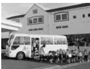
▲サテライト保育による通園イメージ

進めます。 全国初！サテライト保育所が開設 4億6,979万円 4月に全国初となる送迎機能を持つ本園・分園の認可保育所が開設します。利便性の高い豊洲駅の近隣に登降園できる分園と、広い保育スペースが確保できる有明地区に本園を設けることで、保護者のニーズに合った保育を実施します。