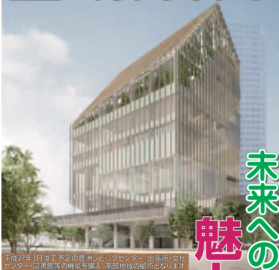
平成27年3月竣工予定の豊洲シビックセンター。出張所・文化センター・図書館等の機能を備え、南部地域の拠点となります