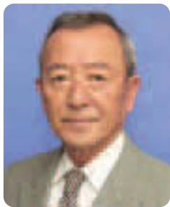
江東区長 山崎孝明

平成26年度は、「江東区長期計画」(前期)の最終年度となり、また、東日本大震災の教訓を踏まえた「防災都市江東」の取り組みが一定の成果をあげていることから、平成26年度当初予算案を、長期計画(前期)と