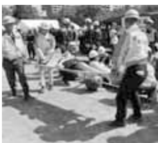
▲木場公園での総合防災訓練の様子

1,201万円 災害時に自ら避難することが困難な人の避難支援や安否確認等の基礎となる名簿(避難行動要支援者名簿)を作成し、平時時から災害協力隊等に提供するほか、拠点避難所となる小・中学校に設置します。