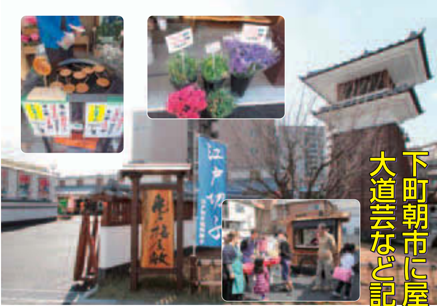
▲ぜひお越しください

亀戸梅屋敷が、3月に開業1周年を迎えます。これを記念し、亀戸の名産品等が並ぶ週末恒例の「下町朝市」を拡大実施します。屋台や大道芸パフォーマンスが早春の亀戸を賑やかにいどります。その他記念イベントはホームページをご覧ください。 時 3月16日(日)・21日(金)・祝・22日(土)・23日(日)・29日(土)・30日(日) 午前10時～午後3時(予定) ㊦どなたでも ㊧当日直接会場へ 場 亀戸梅屋敷(亀戸4-18-8) ☎(6802)9550 HP http://www.kameume.com