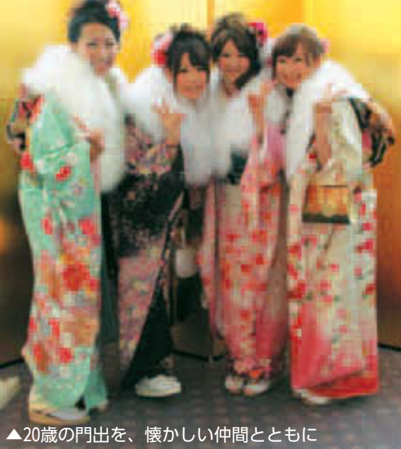
▲20歳の門出を、懐かしい仲間とともに