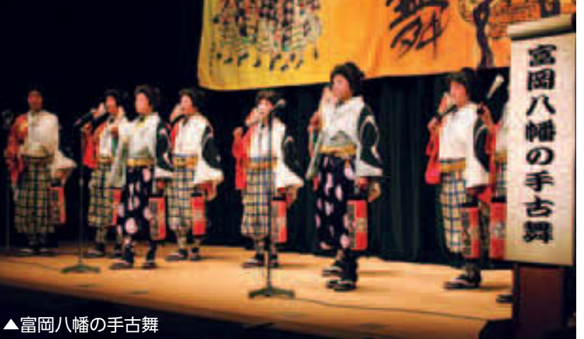
▲富岡八幡の手古舞

区内に伝えられた民俗芸能を 一挙公開します。江戸の昔、仕 事や祭、農村の娯楽などから生 まれた民俗芸能は、江戸の文化 を現代に伝えるものです。江戸 の粋と磨き抜かれた技をご堪能 ください。