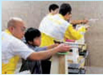
▲ライフル射撃(CP)を模擬体験