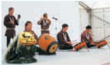
▲開始式を前に伝統芸能でおもてなし(セーリング)