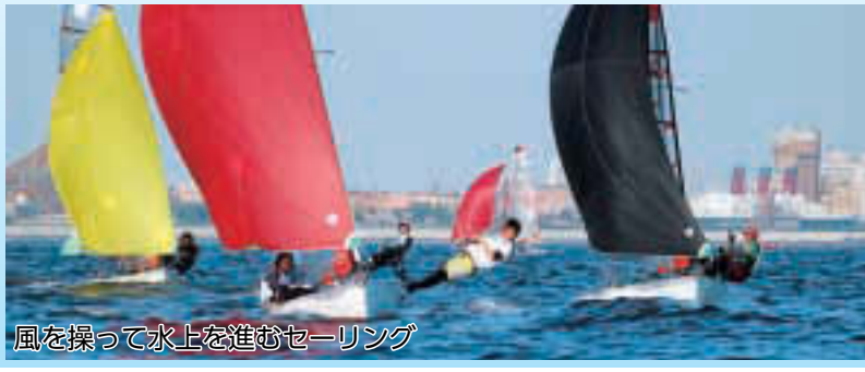
風を操って水上を進むセーリング