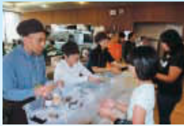
▲障害者通所施設の方からクッキーのふるまい(ライフル射撃(CP))