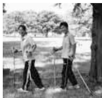
▲あなたもエクササイズを

中川御制札記とは、中川番所の通関手続きや将軍お成りの節の対応方などをまとめたもので、番所が行う業務内容や川船統制に対する幕府の考え方等を知らずして貴重な史料です。