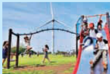
▲昨年度の江東区長賞