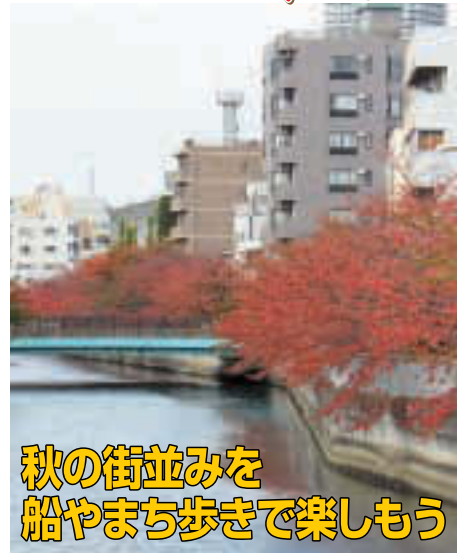
▲美しい紅葉を楽しもう

紅葉が美しい秋の街並みを「古江戸とうとう 紅葉祭り」でお楽しみください。江戸情緒あふれるまちをガイドとともに歩き、「水彩都市・江東」を満喫できます。全イベントで、着物を着た参加者にプレゼントがあります。ぜひご参加ください 時 11月15日(火) 午前9時からファクスにイベント名・名前・住所・電話・生年月日を記入し、NP法人本所深川へ。5は当日時間内に直会場へ ☎ (090) 220060240 FAX (3642) 4127