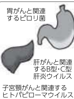
胃がんと関連するピロリ菌 肝臓と関連するB型肝炎ウイルス 子宮頸がんに関連するヒトパピローマウイルス

がんの原因の多くはたばこや飲酒、食事など日常生活習慣に関わるものだと言われています。「がんを防ぐための新12か条」で、がん予防・生活習慣病予防に取り組みましょう。