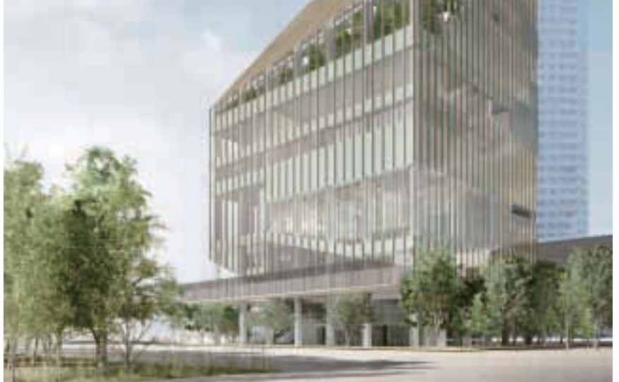
▲ご応募お待ちしております。

現在豊洲駅前建設中の(仮称)シビックセンターは、主に出張所、文化センター、図書館等の機能を備えた区南部地域の公共・文化施設の拠点となる複合施設で、平成27年のオープンを予定しています。 このたび、広く区民の皆さんから親しみ、利用してもらえよう、本施設にふさわしい名称を募集します。なお、応募名称における著作権等一切の権利は江東区に帰属します。 人 なたでも採用されたい方1人に記念品を贈呈(同名応募が多数の場合は抽選) 申 11月8日(金) 必着 区役所、区内各出張所、