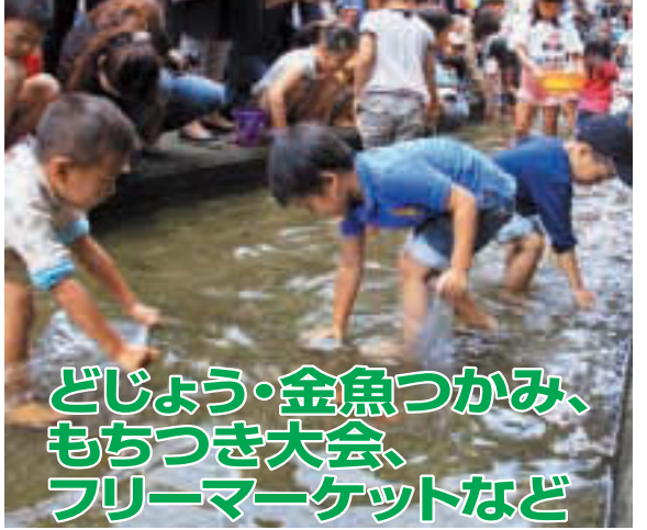
どじょう・金魚つかみ、もちつき大会、フリーマーケットなど ▲たくさんのだじょうと金魚をつかみどり!

今年で29回目を迎える砂町地区大会は、仙台堀川公園「であいの広場」を主会場として開催されます。午前10時から砂町小学校での開会式典後、主会場までの道のりを砂村囃子や鼓笛隊、流し踊りなどが練り歩くパレードを行います。今年も楽しい催しをご用意しています。皆さんぜひご参加ください。 時 10月6日(日) 午前10時～午後3時(各催事のコーナーは11時～、どじょうつかみは午後0時と午後0時15分) 小雨決行