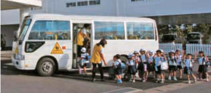
▲(仮称)江東湾岸サテライト保育による通園イメージ

平成25年4月1日現在の江東区の待機児童数は416人となり、昨年に比べ163人増加しました。区では、平成19年度から24年度の6年間で保育施設の定員を、3,374人、59施設増やしてきましたが、大規模マンション建設に伴う乳幼児人口の増加等により、保育需要は急激に増え続け今日に至っています。平成26年4月までに、待機児童のほとんどを占める0歳児から2歳児までの定員を600人、3歳児以上の定員600人の合計1,200人の保育施設を整備し、待機児童ゼロを目指して一層の努力を続けます。