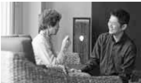
▲入居者の自立生活を介護職員がサポート (写真は運営法人のデイサービスの様子)

区内17か所目の認知症高齢者グループホームを整備 平成25年11月1日(金)開設