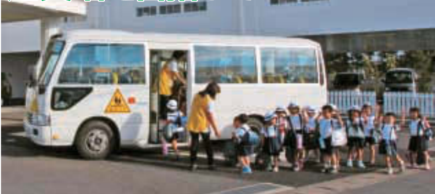
▲(仮称)江東湾岸サテライト保育による通園イメージ

平成25年4月1日現在の江東区の待機児童数は416人となり、昨年に比べ163人増加しました。区では、平成19年度から24年度の6年間で保育施設の定員を、3,374人、59施設増やしてきましたが、大規模マンション建設に伴う乳幼児人口の増加等により、保育需要は急激に増え続け今日に至っています。平成26年4月までに、待機児童のほとんどを占める0歳児から2歳児までの定員を600人、3歳児以上の定員600人の合計1,200人の保育施設を整備し、待機児童ゼロを目指して一層の努力を続けます。