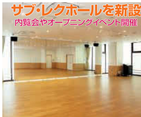
▲サブ・レクホールの壁には可動式の鏡を設置し、ダンス等にご利用いただけます

○給湯室にIH機器を 安全性を考慮し、給湯室のガスコンロをIH機器に、給湯器を電気式に変更しました。 ○遮音性を高めたドア 会議室等のドアを、遮音性の高いドアに変えました。