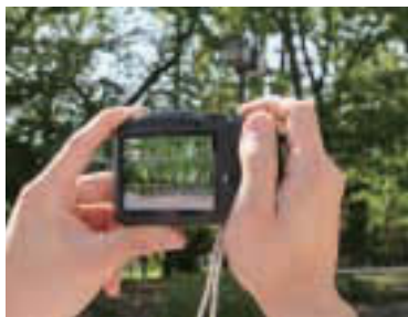
▲皆さんの自慢の緑をお寄せください

また、地域の緑化活動の中心となる人材育成を目指し、「ベランダガーデニング講座」(詳細は3面)の実施、新たに生垣や植樹帯または屋上や壁面、ベランダなどでの緑化の設置費用の一部助成も行っています。詳細は区ホームページをご覧ください。どうかお問い合わせください。