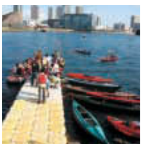
▲カヌーなどの乗船体験ができます

区では、区内の河川・運河で、東京都が施工した耐震護岸上を区が整備し、水辺と緑のネットワークづくりの一環として、区民の皆さんに、水辺に親しめる散歩道として開放する「水辺・潮風の散歩道整備事業」を進めています。引き続き本事業を進めていきますので、ご理解、ご協力をお願いします。 問 河川公園課工事係 ☎(3647)2089