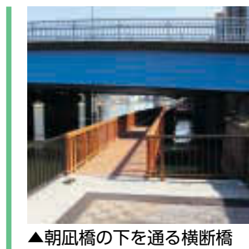
▲朝風橋の下を通る横断橋

豊洲カーニバル 豊洲地区の住民・企業・学校が連携して盛り上げるお祭りです。午前11時に豊洲公園からパレードが出発し、到着する新豊洲駅前でセレモニーを開催します。パレードでは、国内外の子どもたちや大人からなる約20のチームが歩道を華やかに練り歩き、日本の文化と未来、海外の文化と未来を表現します。また、新豊洲駅前の空き地ではショー