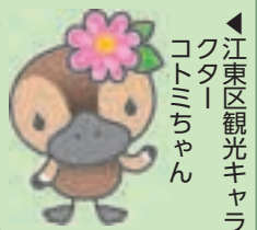
▲江東区観光キャラクタ「コトミちゃん」

4月から「一般社団法人江東区観光協会」が本格的にスタートします。同協会は、東京ゲートブリッジなどの観光スポットが次々オープンし観光ムードが盛り上がる中で、地域や分野を越えて区全域の観光資源を効果的にPRし、地域活性化や地元への誇りや愛着を持てるまちづくりの推進をはかることを目的に設立されました。今後は深川・亀戸両観光協会やNPO法人、区内関連団体等と密接に連携し、本区の魅力を全方位的に発信して観光客の誘致に努めていきます。