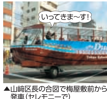
▲山崎区長の合図で梅屋敷前から発車(セレモニーで)

また、併設のターミナルからは都内初の水陸両用バスが毎日発着しています。亀戸・大島地域を巡るほか、旧中川・川の駅で迫力ある進水が体験できます。 【発着時間】 午前10時、11時30分、午後1時、2時30分、4時(夏季)※所要約70分(費)大人2,500円、小人1,200円 【乗車】 平日の1か月前から、電話でスカイバスコールセンター