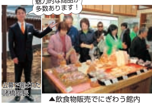
▲飲食物販売でにぎわう館内

世絵師の歌川広重が描いた「名所江戸百景 亀戸梅屋敷」の原画展示、地元住民や観光客が自由に利用できる休憩所、各種イベント実施などに活用できる多目的ホールなどが備えられ、地域住民・観光客等々なたでも楽しめます。