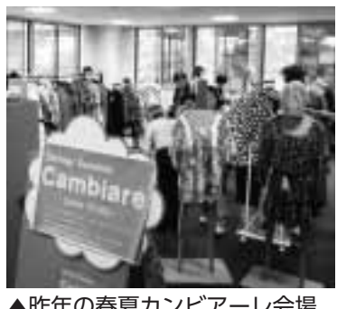
▲昨年の春夏カンビアーレ会場