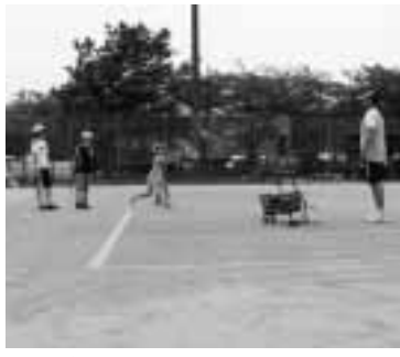
▲小学生テニス教室

小学生テニス教室参加募集 時 5月19日(日) ①午前10時30分～②午後1時30分(各回2時間) ☎・FAX(3647)9230 FAX(3647)9274