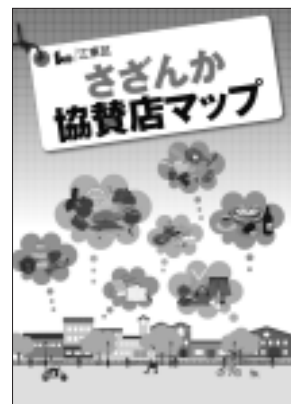
携帯にも便利なA5サイズ

協賛店や暮らしのプチ情報等を紹介する「さざんか通信春号」が完成しました。ぜひご覧ください。また、行ってみたい協賛店を探しやすく、コンパクトで携帯できる地図「さざんか協賛店マップ」は、3月末配布予定です。なお、景品が抽選で当たるスタンプラリーは、今月で終了となります。3月末日(消印有効)までにご応募ください【配布場所】さざんか協賛店、経済課(区役所4階)、こうとう情報ステーション(区役所2階)、出張所、大江戸線門前仲町駅、新宿線西大島駅ほか 問 経済課商業振興係 ☎3647-9502