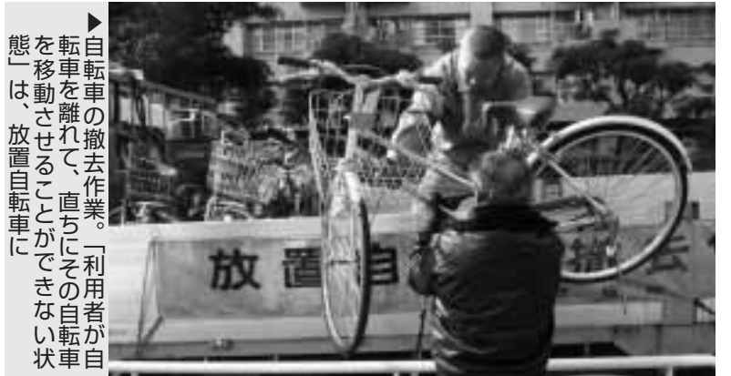
自転車の撤去作業。「利用者が自転車を離れて、直ちにその自転車を移動させることができない状態」は、放置自転車に