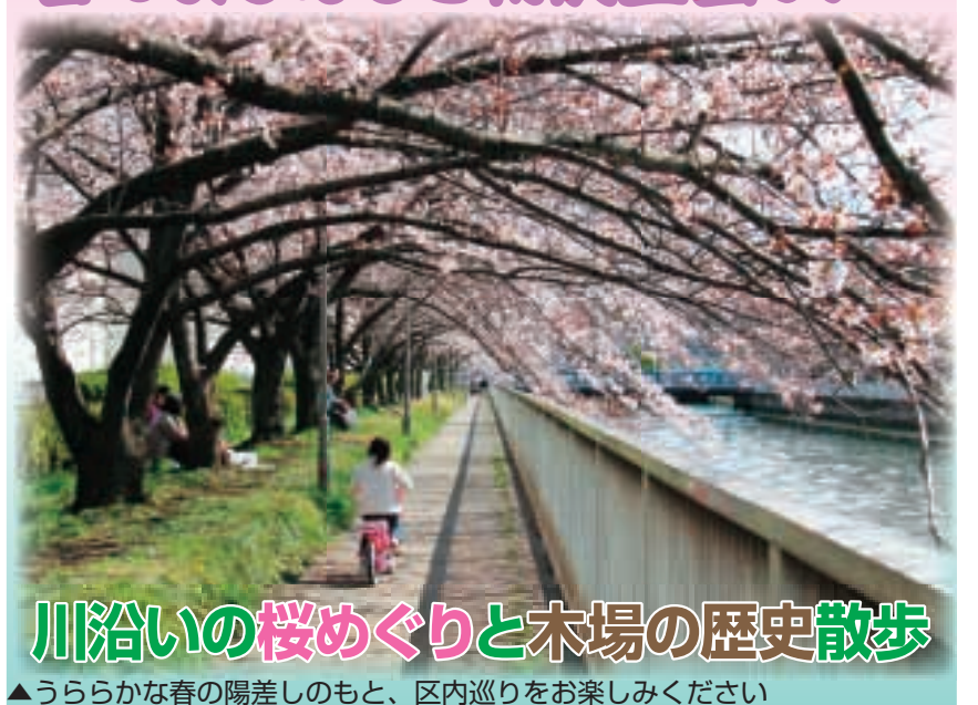
▲うらかな春の陽差しのもと、区内巡りをお楽しみください

文化観光ガイドお勧めの穴場桜スポットをまちあるきしながら、隆盛を極めた活気あふれる木場の歴史をご紹介します※参加者にはプレゼントを進呈。 時 4月4日(木)〜7日(日) ①午前10時〜12時半 ②午後1時〜3時半(全8回) ※少雨決行 当日の混雑状況で解散時間が延びる場合あり 集 出発時間の10分前までに東西線木場駅3番出口へ。解散は森下文化センター(森下3-12-17) 入 2時間半 まち歩きできる方各回30人(申込順) 費 500円(保険、資料代) ※当日支払い 内 木場の歴史および桜の名所のご紹介 申 3月15日(金) 午前9時から江東区文化観光ガイド事務局(江東区文化観光課内) ☎(3647)8588