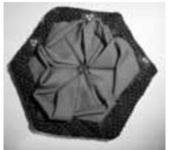
▲フラワーのコインケース

入 どなたでも200人(先着順) 申 当日直接会場へ 場 男女共同参画推進センター(扇橋3-22-2、パルシティ江東内) ☎(5683)0341