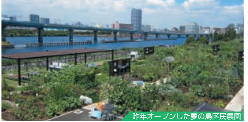
昨年オープンした夢の島区民農園