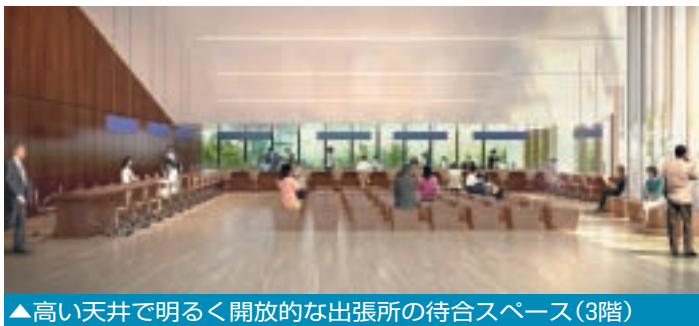
▲高い天井で明るく開放的な出張所の待合スペース(3階)