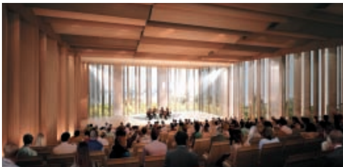
▲300席のホールを新設。舞台には開閉パネルがあり、外の景色を背景に演目を楽しむことも可能(4~5階)