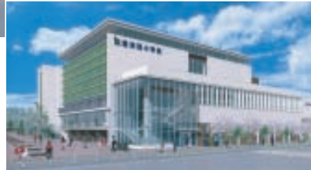
▲体育館棟には、児童用の昇降口とは別に専用の出入り口を設置

豊洲地区の児童人口増に対応するため、平成19年度に開校した豊洲北小学校に続き、2月から豊洲5丁目(仮称)豊洲西小学校新築工事が着工します。校舎棟と体育館棟からなる建物には木材を積極的に使用し、壁面・屋上緑化や校庭芝生化で緑豊かな空間となる予定です。体育館棟は校舎棟から独立させ、通年利用できる屋内プールやトレーニングルーム等を整備します。学校の授業がないときには地域開放を想定して専用の出入口を設け、児童の活動エリアと区分できるようにしています。平成27年4月開校予定です。 関係教育委員会事務局学校施設課計画担当 ☎(3647)8543