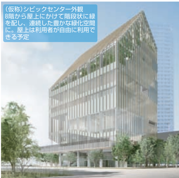
(仮称)シビックセンター外観 8階から屋上にかけて階段状に緑を配し、連続した豊かな緑化空間に。屋上は利用者が自由に利用できる予定