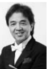
▲宮本文昭さん

東京シティ・フィルの今年度テーマ「完全燃焼」に向かって、音楽監督の宮本文昭指揮でお贈りする演奏会の直前リハーサルの様子をご覧ください。時 3月15日(金) 午後2時20分~4時30分 ※途中入場できない場合があります。時間厳守 場 ティアラこうとう大ホール(住吉2-28-36) 区内在住・在勤・在学の6歳以上の方400人(申込順) 無料