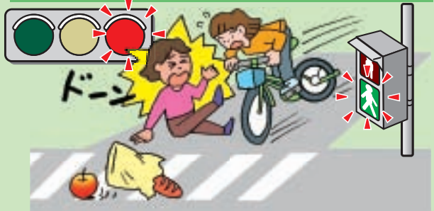
※自転車運転者は重過失致死罪の実刑判決

事故例 2 道路の右側を二人乗りでスピードを出しすぎて、自転車と衝突、死亡させる。