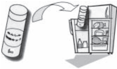
■専用容器に持病・服薬等の医療情報や緊急連絡先等記入した情報用紙を入れ冷蔵庫へ。いざというとき安心です。

「高齢者あんしん情報キット」とは、救急医療などの際に適切で迅速な処置ができるように、専用の容器に持病や服薬等の医療情報や緊急連絡先等記入した情報用紙を入れ冷蔵庫へ。いざというとき安心です。 療情報や緊急連絡先等を記載した情報シートを入れて冷蔵庫に保管しておくものです。 区内20か所の在宅介護支援センターまたは高齢者支援課地域福祉係窓口で、申請にもとづき無料で配布しています。 ☎(3647)9468 FAX(3647)9247