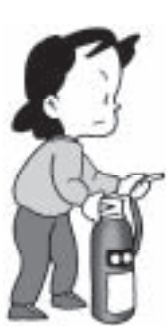
消火器あっせん価格(消費税含む)

※古い消火器の引き取りのみをご希望の場合は、東京都消防設備協同組合第15支部までご相談ください。 ☎(3631)1746