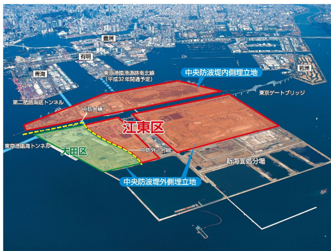
東京都自治紛争処理委員による調停案

本区から接続する中央防波堤内側埋立地及び中央防波堤外側埋立地の帰属については、平成28年4月から行った大田区との協議では解決が図れなかったことから、平成29年7月18日、都に対して調停申請を行いました。その結果、地先の尊重という観点から等距離線方式が採用されるとともに、以下に掲げる本区の主張が概