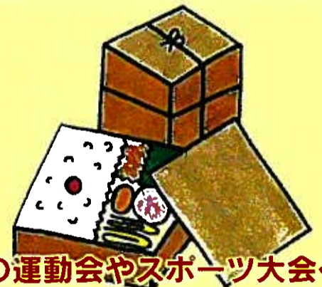
地域の運動会やスポーツ大会への 飲食物の差し入れ