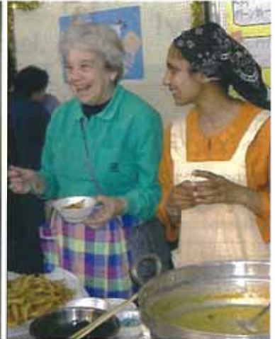
世界の食卓 WORLD DISHES

18 <Sun> March/2012 11:00am-4:00pm Sogo Kumin Center