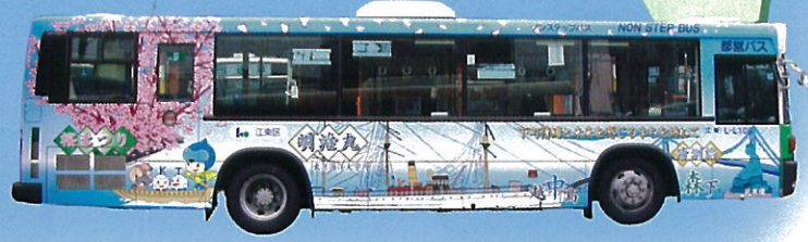
※ラッピングバスは、平日は区内他系統を運行しています。