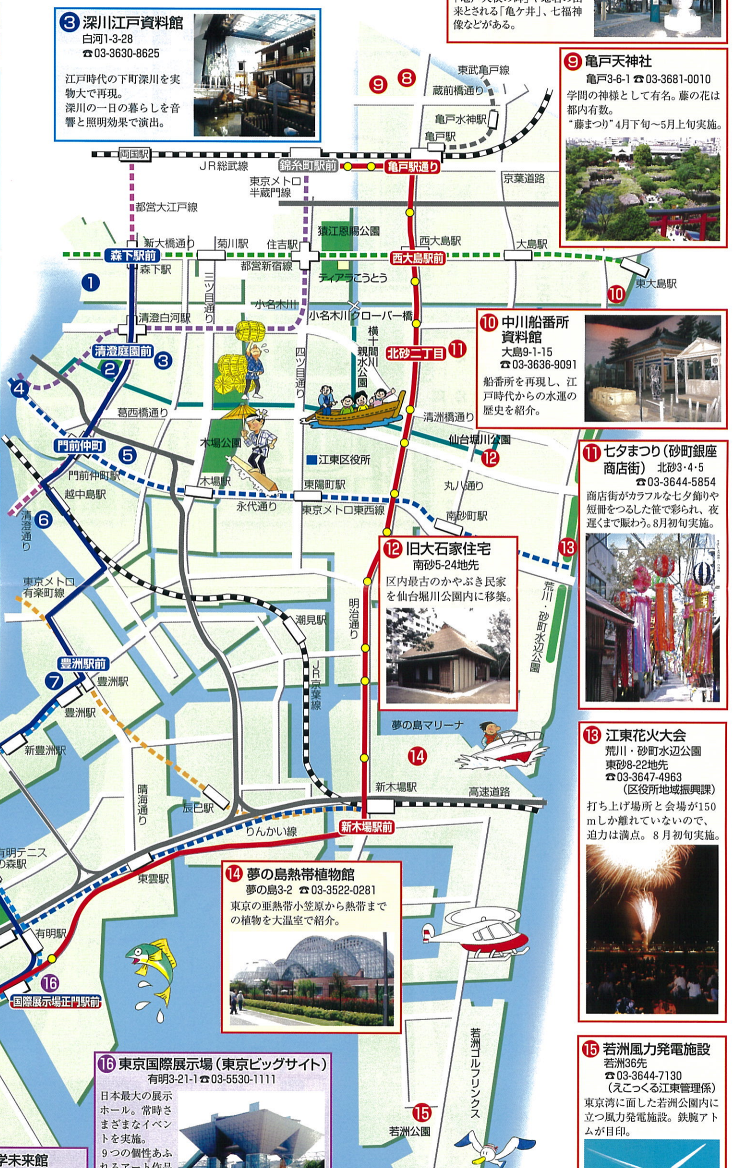
このマップはH21.5現在のものです。