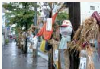
かかしコンクール

※中川船番所資料館休館日:月曜日(祝日及び振替休日の場合は翌日休館) ※深川江戸資料館・芭蕉記念館休館日:第2・4月曜日(祝日及び振替休日の場合は翌日休館)