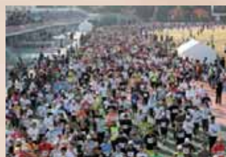
江東シーサイドマラソン大会