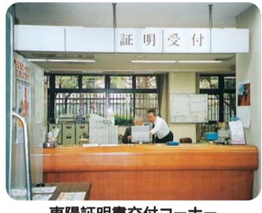
東陽証明書交付コーナー

代理 扶助費が増大し、厳しさを懸念する。あるべき姿であり、求める考えはない。求める考えはない。(ア)住民福祉向上に寄与するもので本来の役割に沿ったものである。(イ)区民の信頼に応えた予算である。