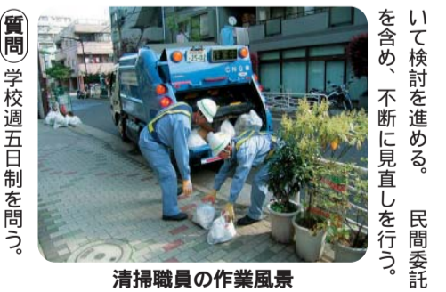
清掃職員の作業風景

質問 十六年度予算編成を問う。民営化推進の基本的考え方は。民営化は区民の視点で評価を。施設民営化の今後の予定は。 代理 限られた財源を有効活用するため、推進する。区民の理解が不可欠と考える。保育園等の公設民営化を推進する。 質問 清掃問題を問う。厳しい条件下で働く清掃職員の身分処遇問題への対応は。職員定数に対する認識は。 代理 給与の適正水準等につ