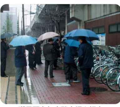
潮見駅自転車駐車を視察 (南北交通・放置自転車対策特別委員会)