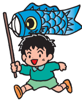
イベントでにぎわう「のらくろ」

この一般質問は、会議録に全文を収録します。会議録が出来しだい区内の各図書館でご覧いただけます。さらに、区議会ホームページにも掲載しますので、どうぞご利用ください。 【区議会ホームページ】 http://www.city.koto.tokyo.jp/gikai/