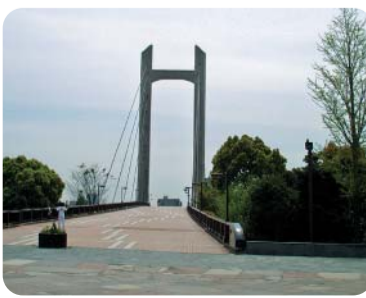
緑あふれる木場公園

質問 十六年度予算編成を問う。民営化推進の基本的考え方は。民営化は区民の視点で評価を。施設民営化の今後の予定は。 代理 限られた財源を有効活用するため、推進する。区民の理解が不可欠と考える。保育園等の公設民営化を推進する。 質問 清掃問題を問う。厳しい条件下で働く清掃職員の身分処遇問題への対応は。職員定数に対する認識は。 代理 給与の適正水準等につ