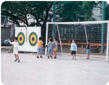
校庭で遊ぶ子どもたち

道徳教育の必要性が高まっているが、人間として実のある基本教育のあり方をどう考えるか。区長直属の諮問機関を設置し、区長はリーダーシップの発揮を。予算・決算特別委員会に教育委員は出席してはどうか。