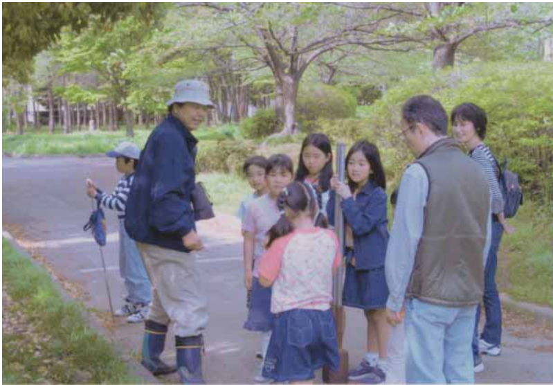
子どもの地域活動を支援する「ウィークエンドスクール・こうとう」(猿江恩賜公園にて)

「継続本会議」 翌六月十二日の本会議では、前日に引き続き、八議員による一般質問が行われました。