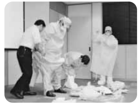
保健所のSARS対策訓練の様子