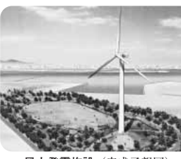
風力発電施設(完成予想図)

保健福祉部長 ①今回の調査結果を踏まえ今後検討する。②地域が高齢者を支える体制を目指す。③補助金の活用を協議する。