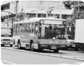
区内を走る都バス