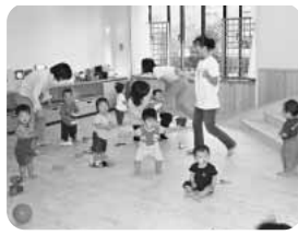
保育園の子どもたち