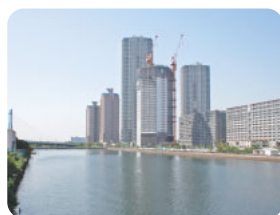
マンション建設が進む東雲地区

本区のまちづくりは、都市計画マスタープランの中で、基本的、体系的指針が示されています。しかし、近年のマンション等集合住宅の建設計画の急増により、学校や保育園等の受け入れが困難となっている地域もあり、その対応等について検討を進めなければなりません。また、災害に強いまちづくりのために、建築物の耐震化及び不燃化の推進についても総合的に検討をしていきます。