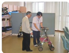
東陽在宅介護支援センター

医療制度改革は、後期高齢者医療制度の創設や医療保険者による保健事業の本格実施など本区の運営する医療保険事業を見直すものであり、この改革に的確に対処するための調査研究をしなければなりません。 また、平成十八年に改正された介護保険制度は、なお被保険者・受給者の範囲の見直しなど制度の改正が検討されていることから、国・都の動きを踏まえ、調査研究をしていきます。