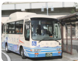
コミュニティバス「しおかぜ」

本区の地下鉄等大量輸送機関は、東西方向には整備が進んでいるものの、南北方向の交通網の整備が急務となっています。このため、バス路線の拡充やLRT(ライト・レール・トラランジット)等について調査研究を行っています。 また、様々な問題を引き起こす放置自転車について、自転車駐車場の整備や撤去、保管等して問題を総合的に調査研究をしていきます。