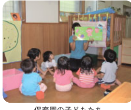
保育園の子どもたち