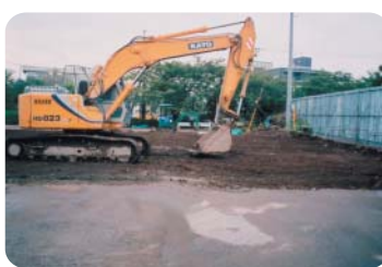
解体工事後の環境センター建設予定地

また、現状をどう認識するのかが、解体工事の発注者に対する事前説明の他区との状況はどうか。解体工事の事前通知を制度化すべきと考えますが区の見解は。