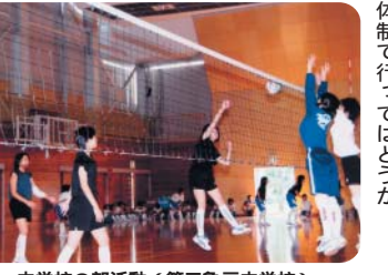
中学校の部活動(第三亀戸中学校)

質問 教育問題を問う。いじめに対する認識と対策は。本区独自にいじめ対策を考えるべきではないか。都が部活動を明確に教育活動と位置付ける報告書をまとめたが、本区への対応は。教育委員会の存在意義が問われているが、本区の場合は、きめ細かな対応をするため、小学校低学年の教育指導を一人体制で行ってはどうか。