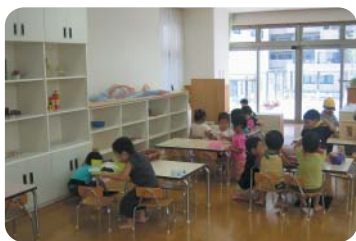
保育園の子どもたち

画の中で示していく。(イ)保育料改定等は受益と負担の公平性の観点から検討すべき課題と認識する。ウ第三子以降の保育料の軽減措置は行っており、検討課題であると認識する。考えでない。園児への影響に十分配慮し民営化を推進していく。