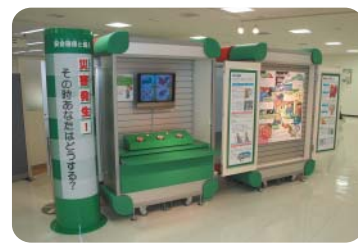
防災センターの展示コーナー

い。展示コーナーは利用状況が少ないため、区報への掲載等を利用して拡大を図る。学校に活用を働きかける。災害協力隊等が区からの情報を受信して適切な非難等の判断に活用する。消防団の活動を区報等で紹介し、側面から協力する。