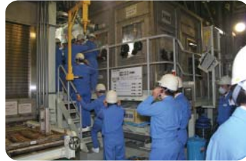
PCB廃棄物処理施設を視察 (清掃港湾・臨海部対策特別委員会)