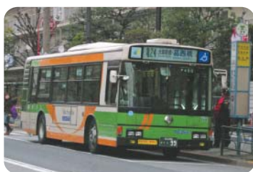
区内を巡る都バス