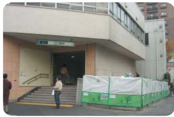
エレベーター工事中の東陽町駅西口

画の中で示していく。(イ)保育料改定等は受益と負担の公平性の観点から検討すべき課題と認識する。ウ第三子以降の保育料の軽減措置は行っており、検討課題であると認識する。考えでない。園児への影響に十分配慮し民営化を推進していく。