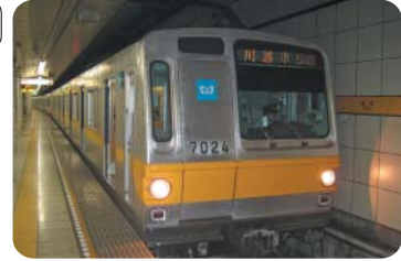
地下鉄八号線(有楽町線)

代理 ア需要予測等の定量的な検討を重ね、段階的整備の具休化に向けた調査を行っている。イ協議会の調査検討の中で整備効果が大きいと評価されており、