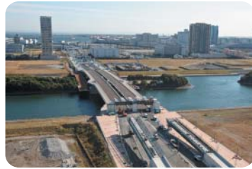
開通した木遣り橋