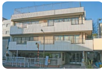
第二あすなろ作業所

【代理】制度を維持するには一定の負担はやむを得ず、直ちに見直しを求める考えはない。新体系に直ちに移行できない施設については、当面補助金の支援を続けていく。支援を検討したい。可能な範囲で支援を行っている。