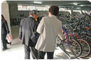
ららぽーと豊洲を視察 (南北交通・放置自転車対策特別委員会)

青海地区の都市計画等について理事者の報告を聴取 南北交通・放置自転車対策特別委員会 (12/5)