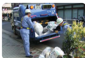
ごみの収集作業の様子