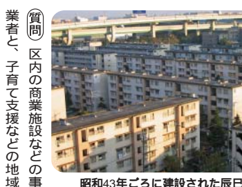
昭和43年ごろに建設された辰巳団地