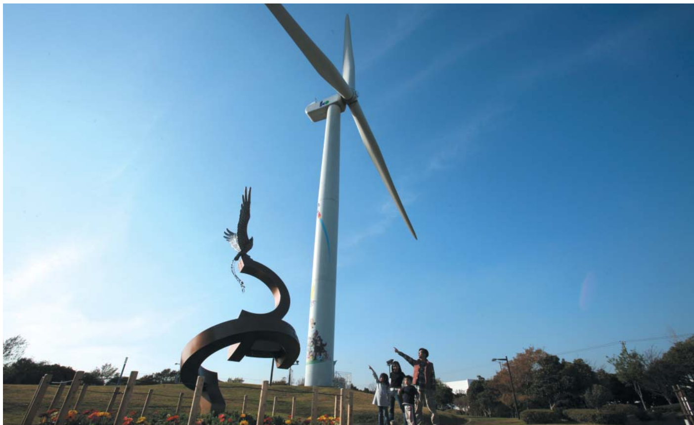
臨海部の風を受け、ダイナミックにはばたく「朱雀」のモニュメント(若洲公園)