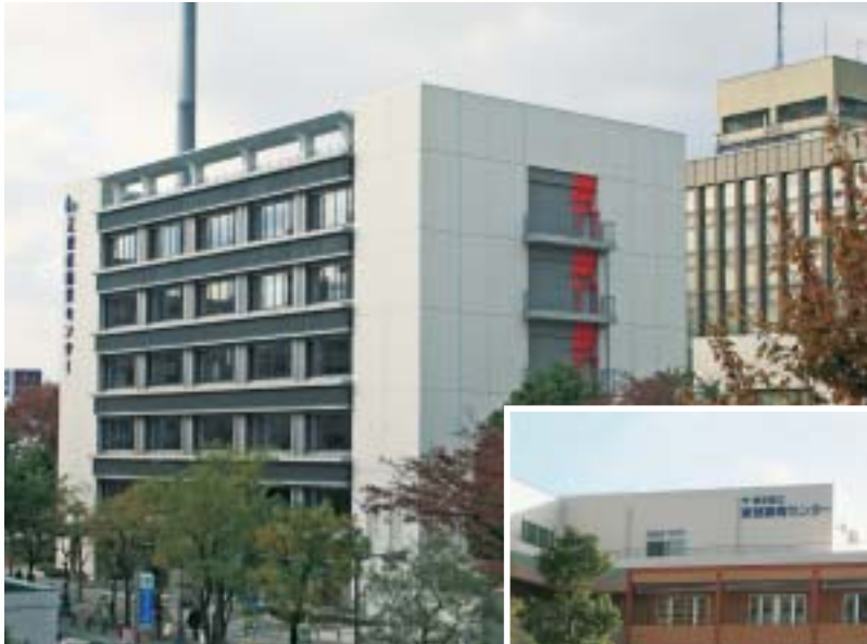
江東区役所に隣接する防災センター