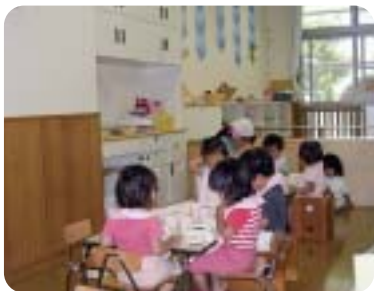
保育園の子どもたち

【質問】子ども生活部長 本区の重要課題である。民設民営、公設民営で効率的かつ柔軟なサービス提供を図る。交付金制度の詳細等は今後の推移を見守ってきたい。