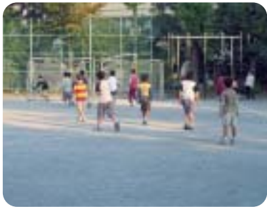
校庭で遊ぶ子どもたち

【質問】子育て支援について 保育園や学童クラブの環境整備をどう捉えているか。 ソフト面ア)保育サービスの充実。イ)児童手当は、ウ)小児向け夜間診療体制の整備は、子ども生活部長 需要増に対応する。ア)拡充に努める。イ)国の動向等を注視する。ウ)地域バランスを考え整備する。