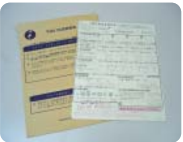
国勢調査の調査票と封筒

調査票提出は全世帯封入を原則にすべきだったのではないかと苦情の主な内容は何か。 区としての調査データ活用は、 区民部長 国の指導に従った。調査の必要性やプライバシーに関する苦情が多かった。都区財政調整の測定数値等に活用している。