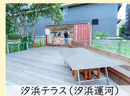
汐浜テラス(汐浜運河)