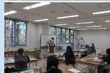
環境学習情報館運営事業