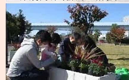
おもてなし緑化(イベント)