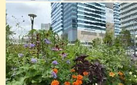
豊洲公園入口のガーデン