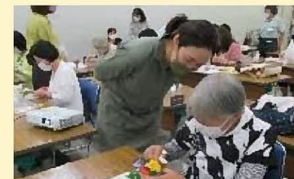
ベランダガーデニング講座

花苗等の資材提供やアドバイザーの派遣等を実施した。その他、コミュニティガーデン見学会の実施や、コミュニティガーデンマップの作成などにより、コミュニティガーデン活動の認知度向上を図った。