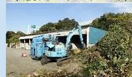
緑のリサイクル事業