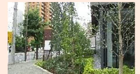
緑化指導（地上部緑化）