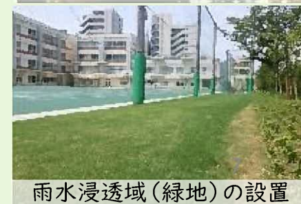
雨水浸透域(緑地)の設置