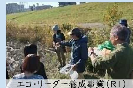
エコ・リーダー養成事業(R1)