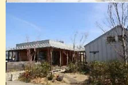
マギーズ東京(豊洲)