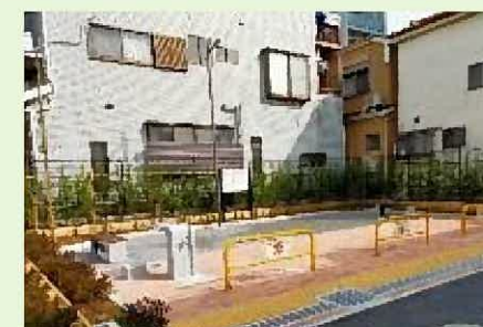
オープンスペース整備 (北砂四丁目第三児童遊園)

※1 まちづくり事業と連携したオープンスペースの確保(オープンスペースの確保)【実施内容】 豊洲駅前に、豊洲二丁目駅前地区第一種市街地再開発事業によるオープンスペースを創出した。