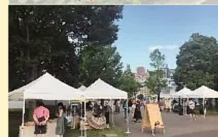
豊洲スタイルマーケット