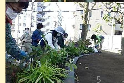
コミュニティガーデン活動