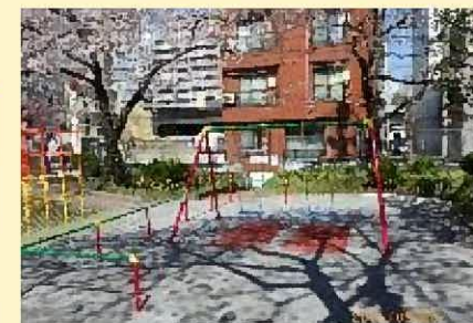
公園整備事業(亀戸公園)