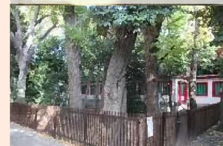
保護樹林(富岡八幡宮)