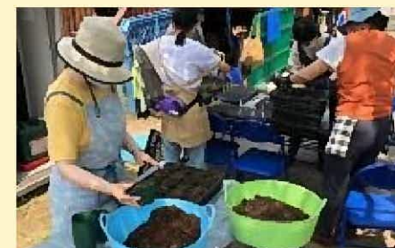
豊洲ガーデンクラブ

都立木場公園内に、東京都の「都立公園多目的活用プロジェクト」第1号案件として、東急コミュニティーが「Park Community KIBACO」をオープンした。もともと公園は人を集める力があるため、誰もが使いやすい施設、美味しい食材、魅力的なイベントを提供することで、公園に集まる人と人、地域と地域を繋ぎ、街の活性化に寄与するコミュニティの実現を目指している。