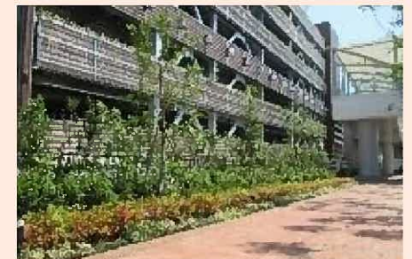
緑化指導（地上・壁面緑化）