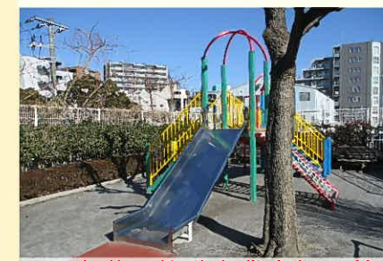
児童遊園整備事業(枝川橋)