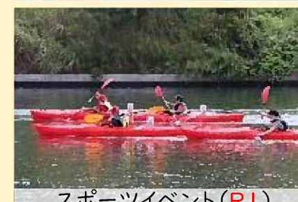
スポーツイベント(RI)