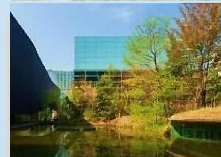
再生の杜(清水建設)