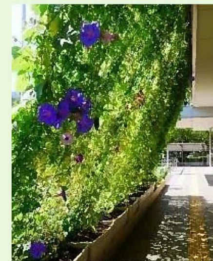
みどりのカーテン (えこっくる江東)