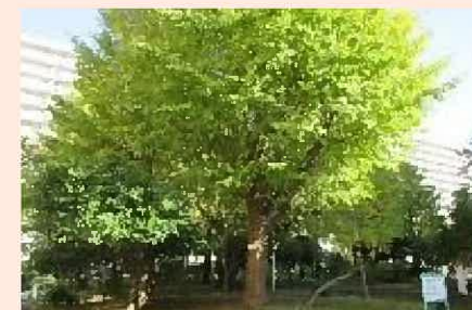
保護樹木(大島三丁目団地)

豊洲六丁目第二公園を花と緑で彩り、地域コミュニティの醸成と東京2020大会への気運醸成を図る取組として、ガーデニング講座、コンテナ花壇への植替えイベントを実施した。(コロナ禍により規模縮小)