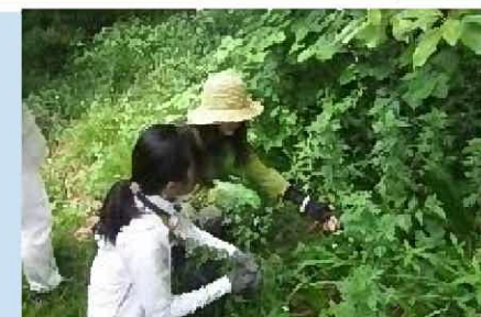
自然とのつきあい事業(H31)

※3 緑のリサイクル事業(剪定枝等チップ化及び堆肥化)【実施内容】 剪定枝等をチップ化・堆肥化し、資材として活用することで、ごみの減量と緑化を推進。 【令和2年度実績】 剪定枝搬入量1817.5m 3 チップ生産量782.8m 3 堆肥生産量298.7m 3