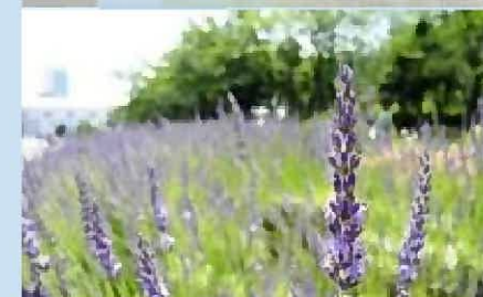
ハーブガーデン (NECソリューションイノベータ)