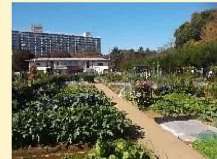
区民農園（城東農園）

コロナ禍の影響により田んぼの学校活動は中止。ボランティアスタッフのみで活動。田んぼ機能維持のための必要最低限の耕作作業を実施。