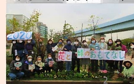
おもてなし緑化(講座)