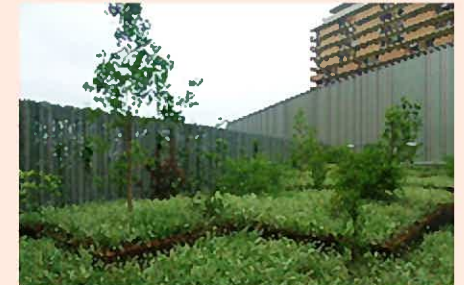
緑化指導（屋上緑化）

一定規模以上の建築物等について、景観計画届出書の提出を義務付けており、このうち、大規模建築物等については、学識経験者で構成する都市景観専門委員会に意見を求め、指導・助言を行った（専門委員会は11回開催、新規案件は26件を審議）。