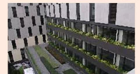
緑化指導（壁面・屋上緑化）