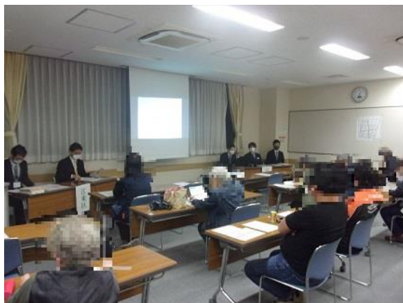
用地説明会の様子