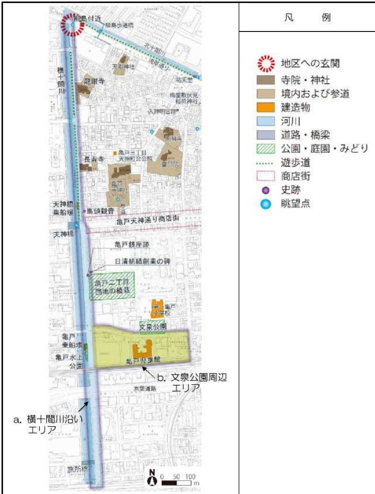
図 横十間川沿い区域のエリア区分図

当区域では、区域全体の共通基準に加え、区域を細分化した各エリアの特徴に応じた基準を設けています。各エリアの景観形成基準は、次ページに示します。