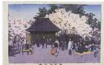
【亀戸梅屋敷/小林清親】

亀戸天神社や亀戸香取神社の境内をはじめ、河川沿いなどに色づく亀戸ゆかりのみどりを、日常の暮らしの中でも身近に感じることのできる景観づくりを進めます。