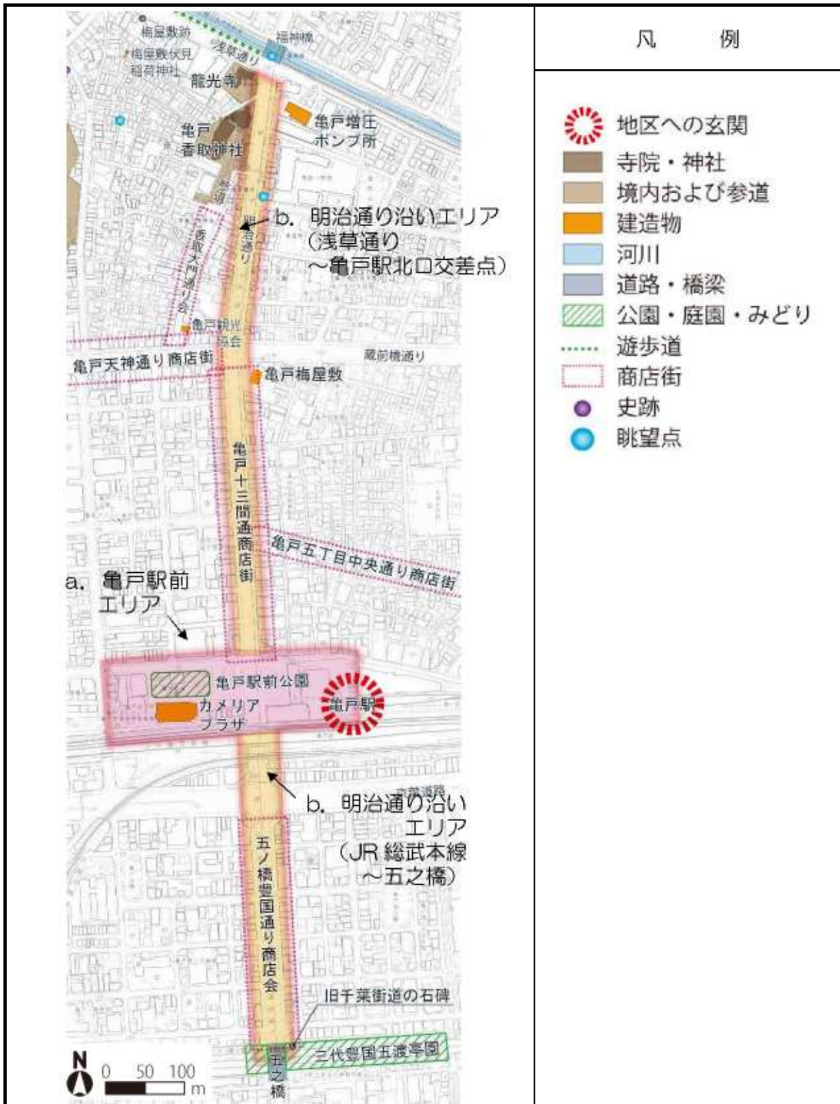
図 明治通り沿い区域のエリア区分図

当区域では、区域全体の共通基準に加え、区域を細分化した各エリアの特徴に応じた基準を設けています。各エリアの景観形成基準は、次ページに示します。