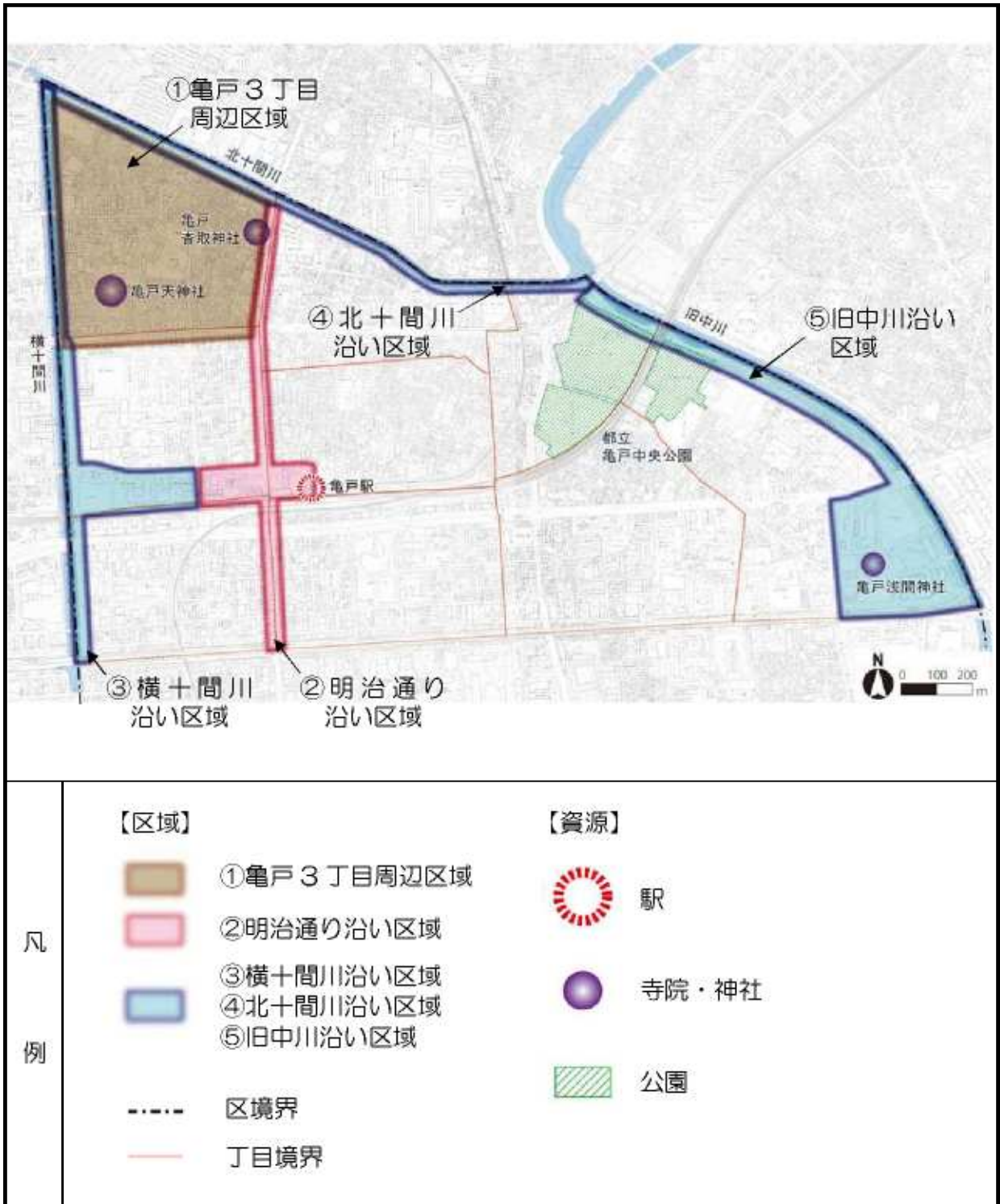
図 亀戸景観重点地区の指定範囲