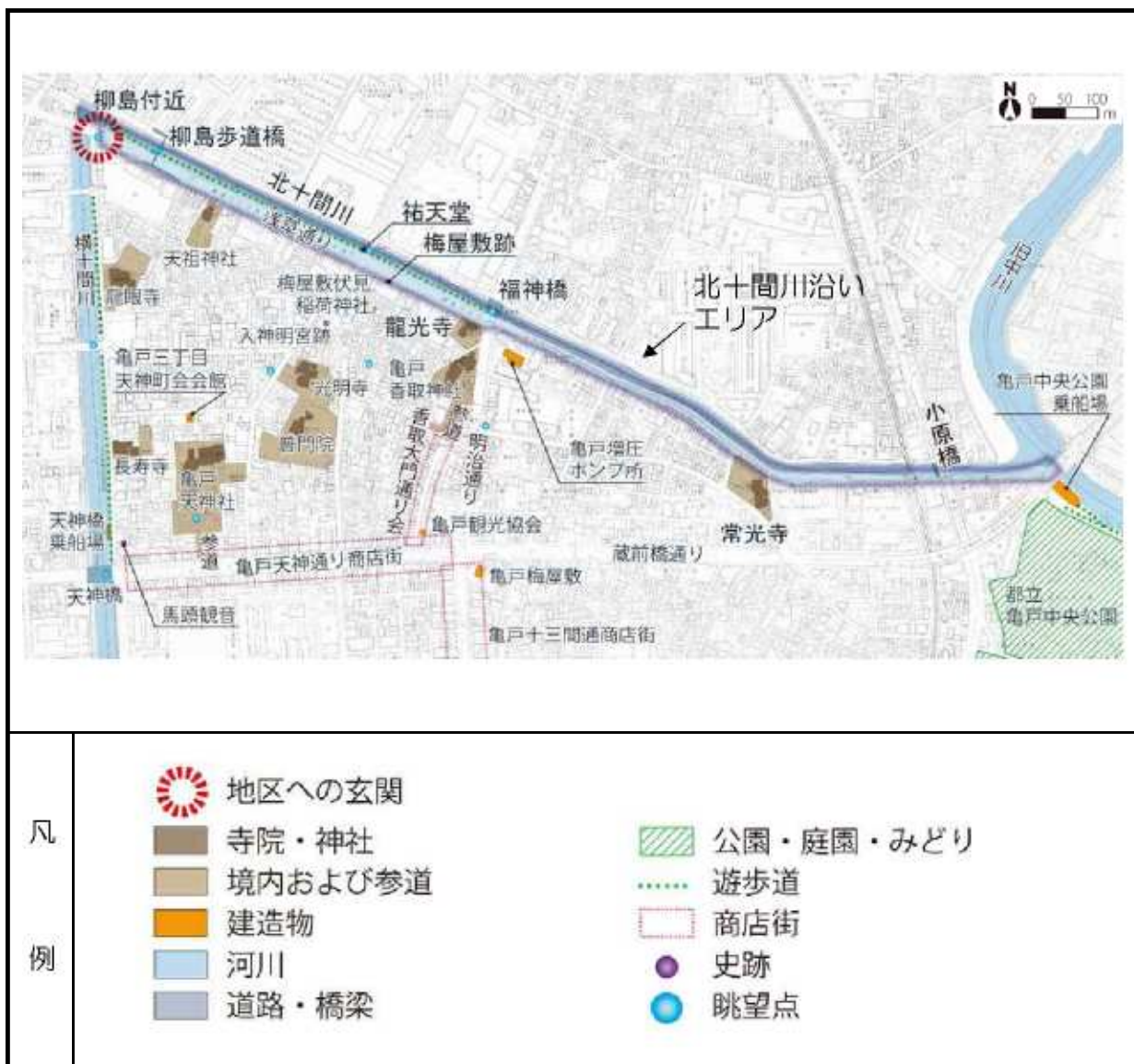
図 北十間川沿い区域のエリア区分図

当区域では、区域全体の共通基準として、「北十間川沿いエリア」の基準を設けています。景観形成基準は、次ページに示します。