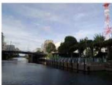
【横十間川と亀戸水上公園】

生活する人々が日常の暮らしの中で、水辺を身近に感じ、また、亀戸を訪れる人々も水辺に集い、まちと水辺の新たな関係が生まれるような景観づくりを進めます。