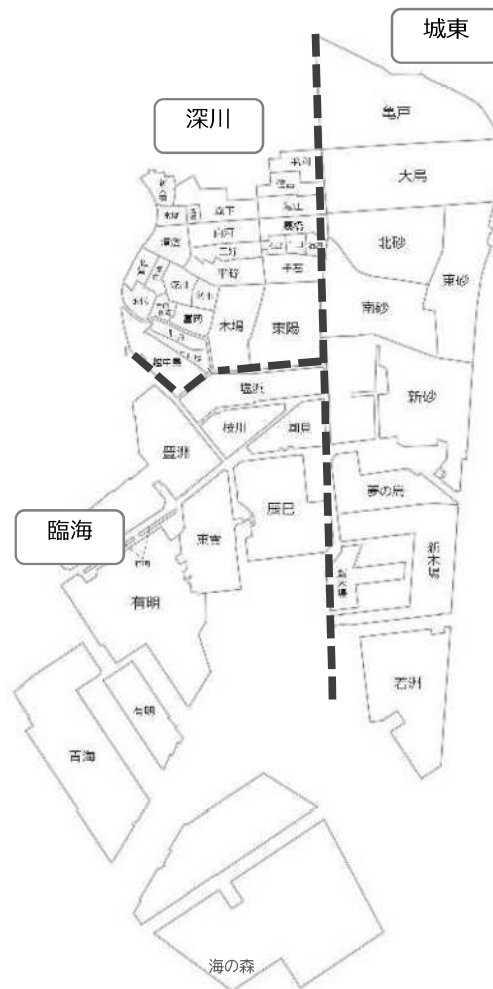
図表 教育・保育の提供区域

教育事業（1号認定）及び地域子ども・子育て支援事業については、区全体をひとつの提供区域として設定しています。