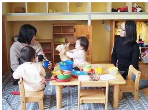
<子ども家庭支援センターの様子>