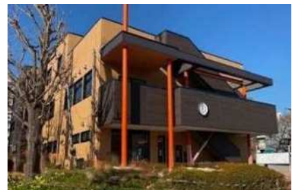
<豊洲枝川さくらんぼ保育園 (令和4年4月開設予定)>

※1 新規開設園数：認可保育所(認可外保育施設からの認可移行を含む)、小規模保育事業所、幼保連携型認定こども園(保育認定児童分) ※2 認可定員増数：既存園の定員変更や認可外保育施設からの認可移行定員を含む ※ H30の新規開設園数及び認可定員増数には年度途中開設園を含む