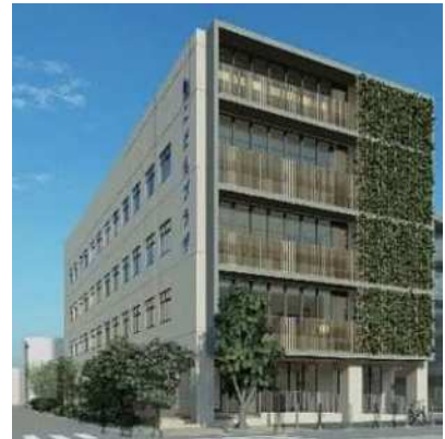
<施設外観(イメージ)>