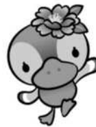
こうとうくかんこう 江東区観光キャラクター コトミちゃん