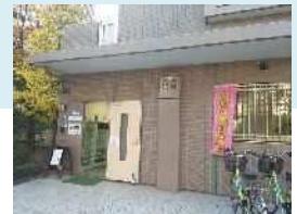
サテライト城東北部 (大島8-28-5)