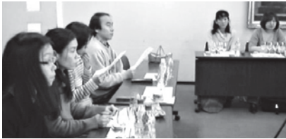
★毎月1回、第4土曜日に森下文化センターで開催しています。

種や産地の違いや醸造法、原産国や年代などを探りながら飲みごろを判定します。ワインを知ることは歴史や地理を学ぶことであり、世界を知ることにつながります。