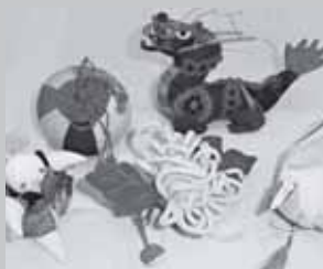
★作品の数々。発表会も定期的に行っています。

月に1作品を目安に、見本やテキストを見ながらみんなで和気あいあいと制作を楽しんでいます。第2・第4水曜日の午前10時から亀戸文化