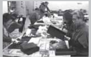
★木目をいかに魅せるかが勝負の時も。

下塗り、中塗り、上塗り、と、何度も塗りを重ねる漆器はその度に美しさと堅牢さを備えていきます。しかし、色漆は顔料を混ぜ合わせて微妙