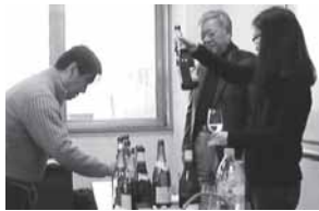
★厳選ワインをテイスティング。

味覚は十人十色。一人ひとり違うので、講座は実戦形式で行われます。先生の自宅にストックしてある1500本のワインの中から厳選したものを教材に使用しています。毎回4・5本試飲して味や香りを分析。品