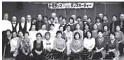
★親睦パーティーで、日々の練習成果を発表。

気軽にコミュニケーションがとれるため心身のリフレッシュにも効果的です。現在数が少ない男性会員募集中です。とくに団塊世代くらいの若い方(笑)を。