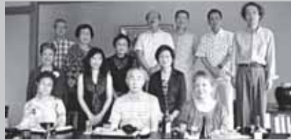
★メンバーは13人。先生を囲んでの親睦会。

な色を調節するので、部分的塗り直しが難しく、一塗り一塗りが真剣勝負。自分のイメージに仕上げるのは至難の業。だからこそ、満足いく出来にはこの上ない喜びがあります。