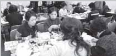
★第3土曜日は東大島文化センターでも開催しています。

センターで開催しています。初心者の方でも分かりやすいよう丁寧に指導しますので、ぜひご参加ください。