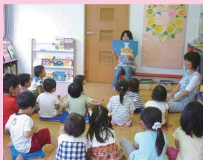
毎回紙芝居やパネルシアターを行っています。

保育にあたっては、七夕やミニ運動会など、季節の行事を取り入れる工夫をしています。また、安全面に配慮して毎月避難訓練を実施しています。月1回、無料の保育説明会も実施していますので、ぜひ一度ご参加ください。