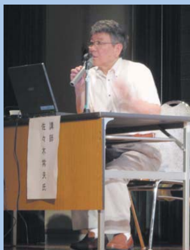
講師 佐々木常夫氏 お話をいただきました。

式会社東レ経営研究所特別顧問)をお迎えし「ワーク・ライフ・バランスで光るみんなの個性」と題して、家族や仕事の危機に直面するなど、自身が体験した壮絶な過去について、それを乗り越え成功に導いた「仕事術」についてお話をいただきました。