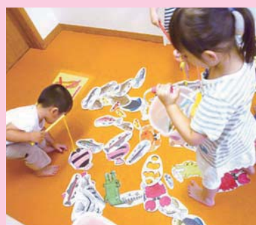
保育士の手作りおもちゃが沢山あります。