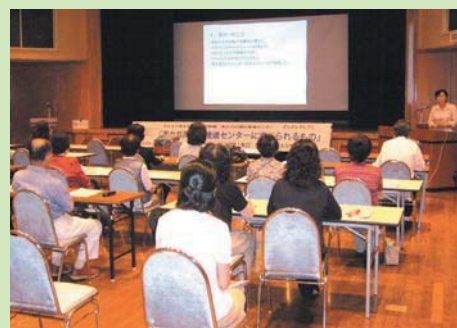
昨年のフォーラムより

な、コミュニケーション・デー トDV・子育て・人権問題など バラエティに富んだ企画が 集まりました。 当日参加可能なイベントも ありますのでご参加ください。 詳細は男女共同参画推進セ ンターにお問い合わせくださ い。