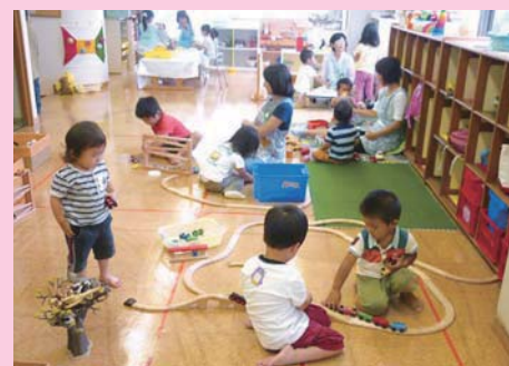
異年齢のお子様と交流できるよう混合保育です。