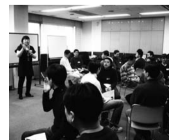
▲30~40代のお父さんが多数参加。会社におけるコミュニケーションやハッピーライフの過ごし方を考えました。

2月11日(祝)、男女共同参画学習講座「お父さんのためのコーチング講座」を男女共同参画推進センターにて開催。また、同時に家族が参加するお楽しみ講座を開催しました。