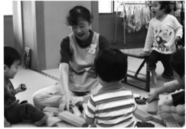
ある日の保育風景。「お母さんのいない場所だからこそ、こどもの気持ちに寄り添って接しています」

私たち「保育研修会'04」のスタッフは女性13名。区の教育委員会主催の「幼児をもつ親の学級」やその後の自主グループ活動時に、主に未就園児の一時あずかりを行っています。