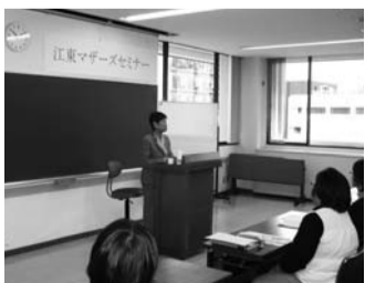
江東マザーズセミナー「親業」には多くの女性が参加。親という仕事に対する関心の高さがうかがわれました。

1月29日、江東区文化センターにて、区とハローワーク木場共催でマザーズセミナー「親業」を開催しました。現在、求職活動中の女性、またすぐの就職を考えているが将来の備えを考える女性約40名が参加しました。一時保育付きというこども小さいお子さん連れの参加者が多く、講師の話に引き込まれながらも、仕事と家庭の調和を再確認する機会になったと好評でした。